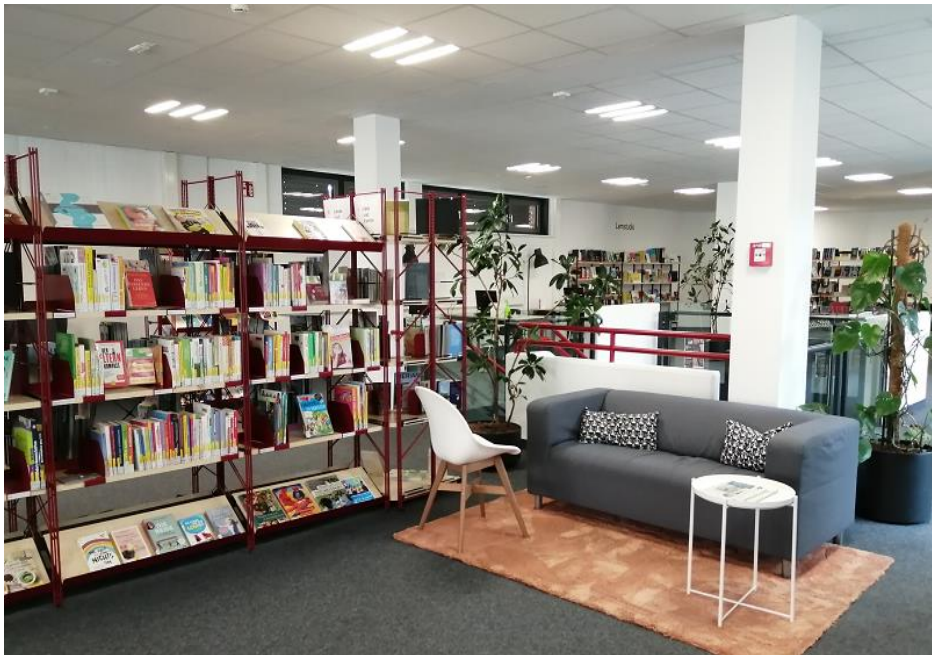
Abbildung 5: Stadtteilbibliothek Chorweiler

Die minibib (von Chorweiler Bibliothek ca 200m entfernt) ist ein Treffpunkt mitten in Chorweiler (am Spielplatz Osloer Straße) mit aktivierenden Programmen und einem ausgewählten Medienangebot für verschiedene Altersstufen, insbesondere Kinder und Jugendliche. Besucherinnen und Besucher müssen keinen Bibliotheksausweis besitzen oder Gebühren bezahlen. Die Ausleihe und Rückgabe der angebotenen Medien erfolgt auf Vertrauensbasis. Die minibib wird aus Schenkungsbeständen der Stadtbibliothek bestückt und vom Lektorat der Bibliothek zusammengestellt. Im Sinne einer guten Leseförderung gibt es Kinderbücher, aber auch Romane und zum Beispiel Sachbücher rund um das Thema Bewerbung und Beruf. Für Kommunikation, Beratung und Betreuung der Angebote während der Öffnungszeiten sorgt, wie in der anderen minibib, ein Team von ehrenamtlich engagierter Bürgerinnen und Bürgern. Das Team der Stadtteilbibliothek Chorweiler am Pariser Platz unterstützt das Angebot.