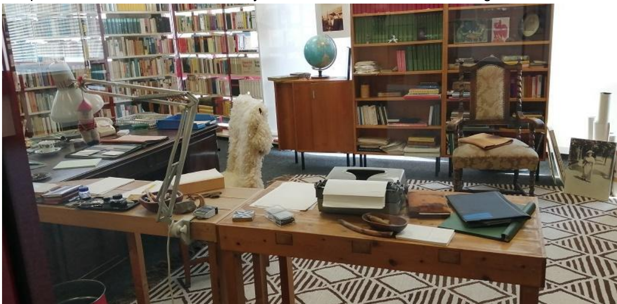
Abbildung 2: Heinrich Bölls Arbeitszimmer und Literatursammlung

Das Heinrich-Böll-Archiv ist eine Dokumentations- und Informationsstelle über das Leben und Werk Heinrich Bölls. In Zusammenarbeit mit dem Historischen Archiv der Stadt Köln, dem Archiv der Erben Heinrich Bölls und der Heinrich-Böll-Stiftung e. V. sammelt und verzeichnet es sämtliche Arbeiten Heinrich Bölls und der Literatur über ihn. Es verfügt über umfangreiche Datenbanken, unter anderem zur Sekundärliteratur, zur Zeitungsausschnittsammlung, Korrespondenz und Manuskriptbestand, zu Übersetzungen der Werke Bölls in über 30 Sprachen. Volltextrecherchen sind in über 280 Interviews und Gesprächen sowie in sämtlichen essayistischen Schriften und Reden möglich.