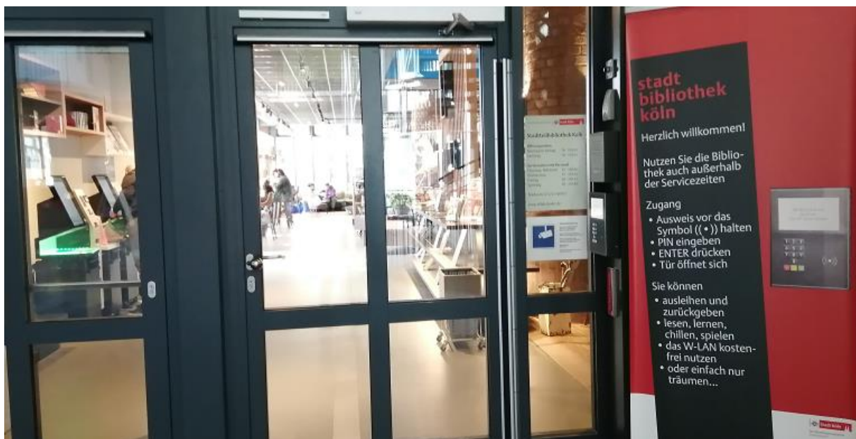
Abbildung 7: Stadtteilbibliothek Kalk - Eingang

Diese moderne Bibliothek ist ein äußerst angenehmer Ort zum Lernen, zur Freizeitgestaltung und zur Auswahl hochwertiger Literatur. Während meines Besuchs war die Zeit der Abschlussprüfungen, die Bibliothek war voll. Dies bestätigt, dass es sich um einen beliebten Studienort handelt.