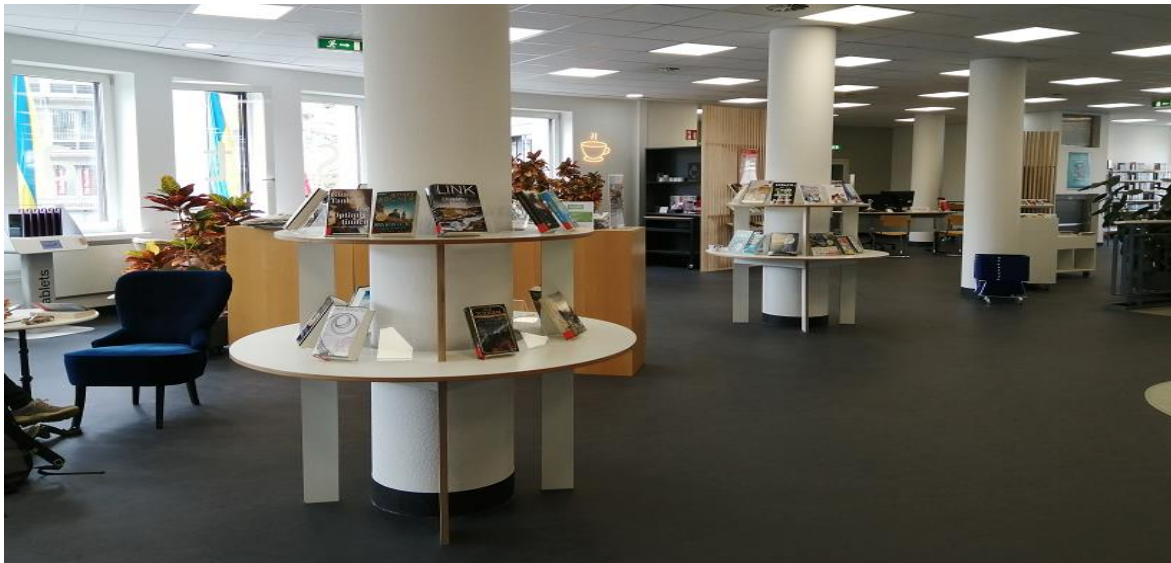
Abbildung 8: Stadtteilbibliothek Nippes

In Nippes befindet sich eine modernisierte Bibliothekszeitungsstelle, die kann viel anbieten. Es erwarten Sie 33.000 Bücher und Medien für Erwachsene und Kinder: Bücher, Zeitschriften und Zeitungen, DVDs, CDs, CD-ROMs, Hörbüchern und Computer- und Konsolenspielen. Ein attraktives Angebot an Romanen (Unterhaltungsliteratur, Klassiker und Bestseller), interessanter Sachliteratur für Hobby, Beruf und Weiterbildung, Sprachkursen, Hörbüchern, DVDs, Computer- und Konsolenspielen wartet darauf, von Ihnen entliehen zu werden. Für den Unterricht in den Klassen 1 bis 13 gibt es einen sehr großen Bereich "Schule und Lernen". Außerdem gibt es zahlreiche Bücher und andere Medien zu MINT-Fächern (Mathematik, Informatik, Naturwissenschaften, Technik).