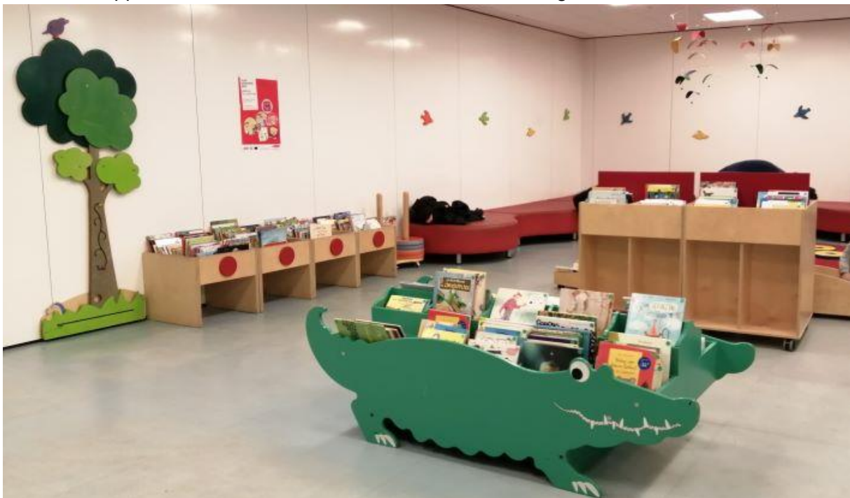
Abbildung 4: Kinderbibliothek

Die Kinderbibliothek hält zahlreiche Plätze zum Arbeiten und Verweilen bereit, darunter mehrere Internet-PCs sowie eine Nintendo Switch zum Ausprobieren für Groß und Klein. Zu Angeboten gehört ein großer MINT-Bestand mit der Bibliothek der Dinge, jahreszeitlich wechselnde Ausstellungen sowie eine große Auswahl an Kindersachbüchern von A wie Affe bis Z wie Zeppelin. Gemütliche Comic-Insel bietet Platz zum gemeinsamen schmökern.