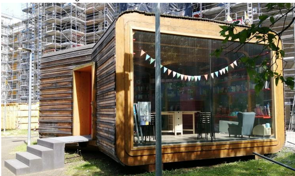
Abbildung 6: minibib am Spielplatz Osloer Straße

Die minibib (von Chorweiler Bibliothek ca 200m entfernt) ist ein Treffpunkt mitten in Chorweiler (am Spielplatz Osloer Straße) mit aktivierenden Programmen und einem ausgewählten Medienangebot für verschiedene Altersstufen, insbesondere Kinder und Jugendliche. Besucherinnen und Besucher müssen keinen Bibliotheksausweis besitzen oder Gebühren bezahlen. Die Ausleihe und Rückgabe der angebotenen Medien erfolgt auf Vertrauensbasis. Die minibib wird aus Schenkungsbeständen der Stadtbibliothek bestückt und vom Lektorat der Bibliothek zusammengestellt. Im Sinne einer guten Leseförderung gibt es Kinderbücher, aber auch Romane und zum Beispiel Sachbücher rund um das Thema Bewerbung und Beruf. Für Kommunikation, Beratung und Betreuung der Angebote während der Öffnungszeiten sorgt, wie in der anderen minibib, ein Team von ehrenamtlich engagierter Bürgerinnen und Bürgern. Das Team der Stadtteilbibliothek Chorweiler am Pariser Platz unterstützt das Angebot.