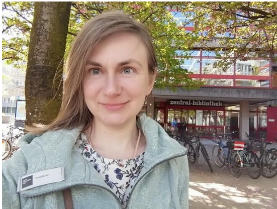
Abbildung 1: vor dem Zentralbibliotheksgebäude

Die Zentralbibliothek liegt im Kölner Kulturquartier in unmittelbarer Nähe des Neumarkts. Dieser Standort ist sehr praktisch, die Bibliothek ist für jedermann leicht zugänglich. Viele Minuten vor der Eröffnung der Bibliothek standen die ersten Dutzende Besucher vor dem Gebäude und warteten ungeduldig auf die Eröffnung.