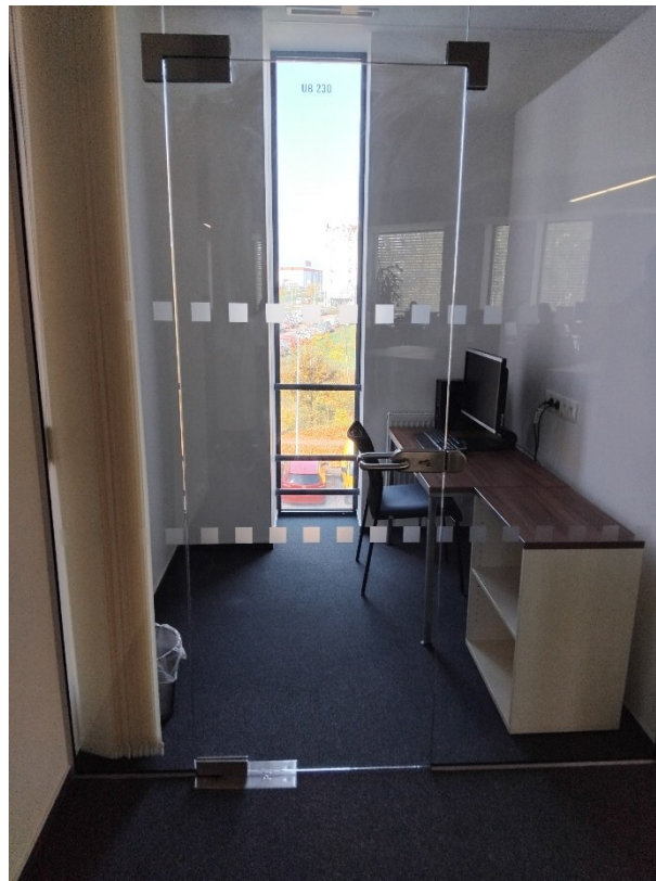
Abb. 5: Palacký-Universität Olomouc, Universitätsbibliothek, Haupteingang